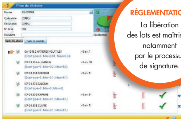
Outil d'aide à la décision lors de la libération des lots, avec accès rapide aux résultats, aux OOS et aux cartes de contrôle.

La libération des lots est maîtrisée, notamment par le processus de signature.